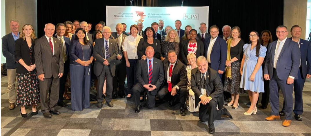
Llun: Aelodau ein Rhanbarth yn bresennol yn y Gynhadledd.