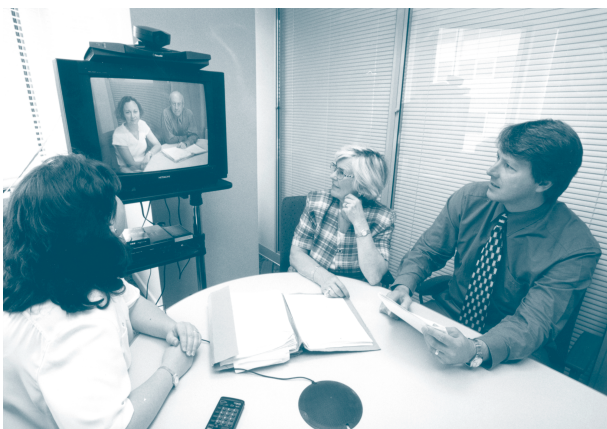
Cynadledda fideo yn helpu i gyfathrebu â chydweithwyr yn Llundain

presennol er mwyn iddynt allu gweithredu, pan fydd angen, fel swyddogion ymchwilio ar ran Ombwdsmon Gweinyddiaeth Cymru; ymgymerodd un ohonynt â'r rôl yn llawn amser. Cafodd aelod ychwanegol o'r staff ei recriwtio yn ddiweddar hefyd i ymchwilio i gŵynion am Weinyddiaeth Cymru yn bennaf. Er iddi fod yn angenrheidiol penodi staff ychwanegol i ymdrin â'r baich gwaith ychwanegol, mae fy swyddfa yng Nghaerdydd yn parhau i fod yn fach, gyda chyfanswm o naw o staff ar hyn o bryd. Darperir gwasanaethau megis personél, cyllid a llety gan swyddfa'r Ombwdsmon Seneddol yn Llundain, y mae gennym gysylltiadau agos â hi. Aeth y gwaith o baratoi ar gyfer datganoli, gan gynnwys cynhyrchu a dosbarthu taflenni cyhoeddusrwydd, a sicrhau'r gwaith o drosglwyddo cyfrifoldeb am achosion o dan ystyriaeth ar 1 Gorffennaf 1999, yn esmwyth, ond rhoddwyd baich trwm ar fy holl swyddfeydd, ac ar Caerdydd yn arbennig. Cyflawnwyd y gwaith yn ddirwgnach ac yn llwyddiannus. Rwyf yn hynod o ddiolchgar iddynt.