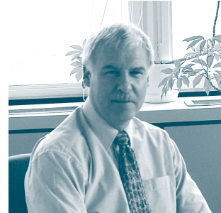
Alan Watson Dirprwy Ombwdsmon

ddatblygwyd gan Ombwdsmon Seneddol olynol wedi'u trosglwyddo i waith Ombwdsmon Gweinyddiaeth Cymru. Gan adlewyrchu'r ffaith hwn, mae'r adroddiad honno yn aml yn cyfeirio at bolisiau a gweithdrefnau traddodiadol neu hanesyddol yn fy swyddfa, er mai dim ond ers mis Gorffennaf 1999 y mae wedi bod mewn bodolaeth. Byddai wedi bod yn drafferthus ac yn bedantig i wneud fel arall. Fodd bynnag, nid yw fy swyddfa ac ni fydd yn dilyn yn slafaid naill ai arfer y gorffennol neu'r arferion newydd a ddatblygwyd gan swyddfa'r Ombwdsmon Seneddol: mae'n bwysig bod ein dulliau yn adlewyrchu anghenion ac amgylchiadau Cymru.