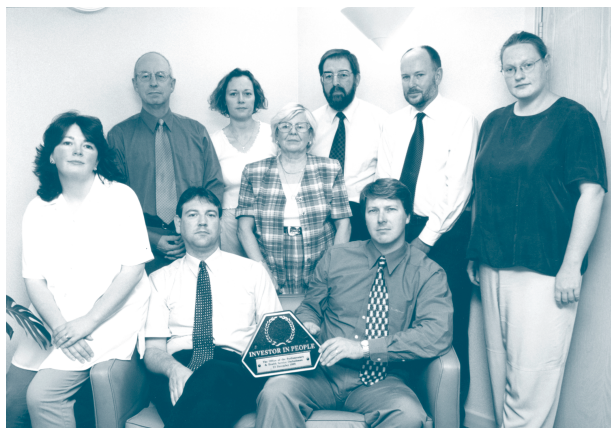
"Buddsoddwyr mewn Pobl" - un ffordd arall o ddangos ein hymrwymiad i safonau trwyadl

1.7 Mae fy staff yn ymdrechu'n barhaus i wneud y broses gwyno yn fwy hygrych ac yn gyflymach i'r achwynwyr. Er mwyn ateb yr her a gyflwynna hyn, mae fy swyddfa wedi parhau i neilltuo ymdrech sylweddol i wella ei systemau rheoli: ymysg pethau eraill, mae wedi coethi ei phroses cynllunio busnes a'i system rheoli perfformiad; mae wedi cyflwyno system TG newydd; ac mae wedi cyflwyno polisiau ar hyfforddi a datblygu ac ar sefydlu. Rwyf yn falch i allu dweud bod llwyddiant yr ymdrech honno wedi'i chydabod pan gafwyd achrediad o dan y rhaglen Buddsoddwyr mewn Pobl ym mis Rhagfyr 1999.