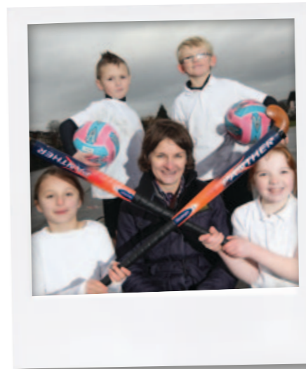
Lansio ein 'Gweledigaeth ar gyfer Chwaraeon yng Nghymru' yn Ysgol Gynradd Eglwys Wen yng Nghaerdydd.