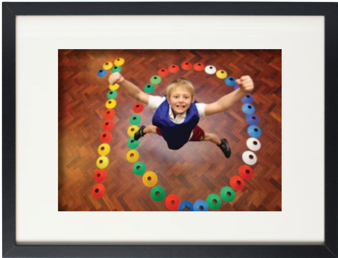
Campau'r Ddraig yn dathlu 10 mlynedd o roi tân ym mol chwaraeon Cymru