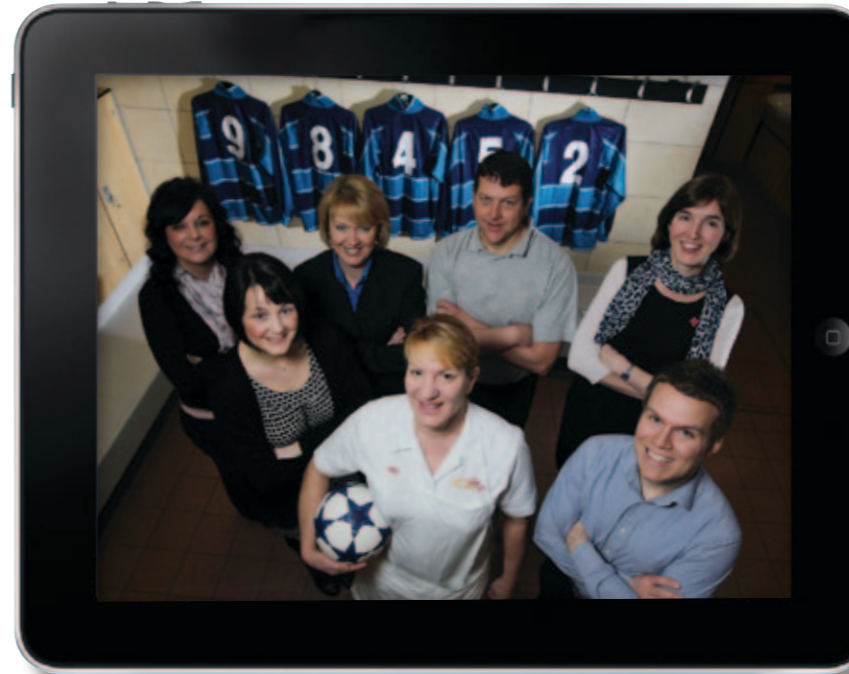
Ni yw'r unig sefydliad sector cyhoeddus cenedlaethol yng Nghymru i gyrraedd 100 Uchaf y Lleoedd Gorau i Weithio ynddynt yn y Sector Cyhoeddus a'r Trydydd Sector yn y Sunday Times ar gyfer 2011