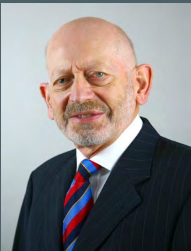
Douglas Bain CBE TD Comisiynydd Safonau'r Senedd

Prif gyfrifoldebau'r Comisiynydd Safonau yw cael cwynion am ymddygiad Aelodau o'r Senedd ac ymchwilio iddynt, cyflwyno adroddiadau i'r Senedd am ei ymchwiliadau, a rhoi cyngor i Aelodau o'r Senedd a'r cyhoedd am y gweithdrefnau gwyno.